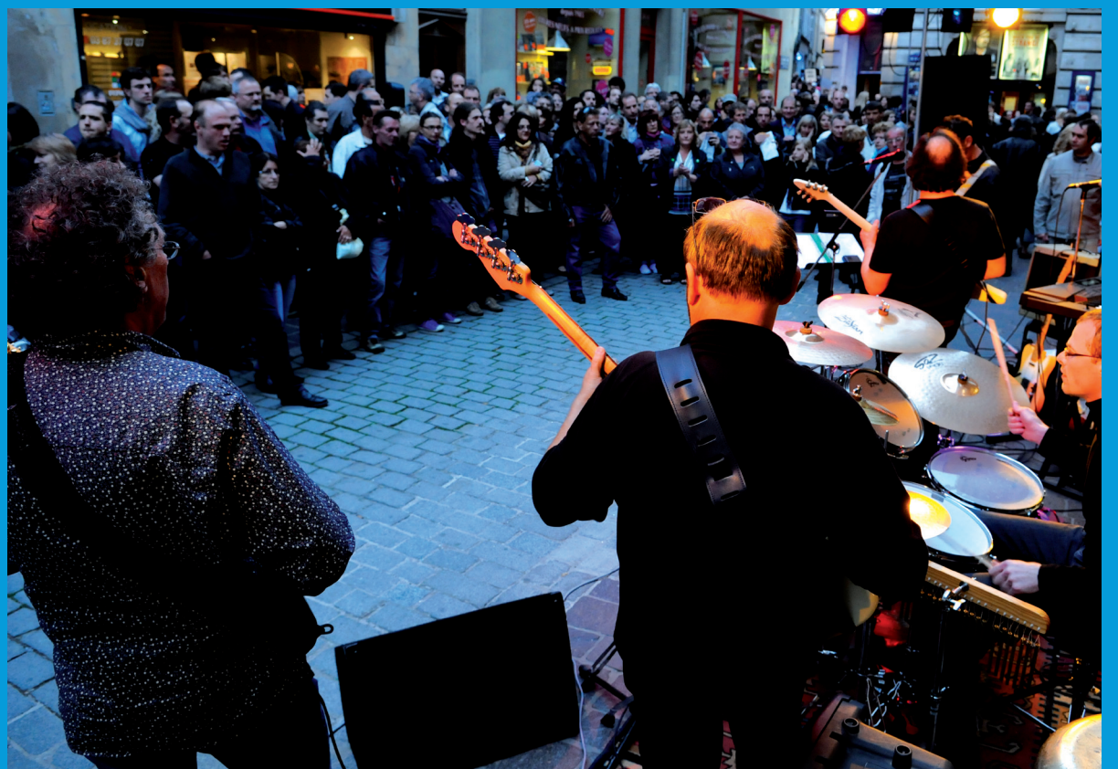
Fête de la musique du 21 juin 2010