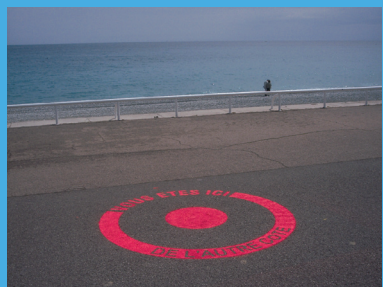
Aline Morvan, Vous êtes ici, diamètre 150cm, peinture au sol, pochoir