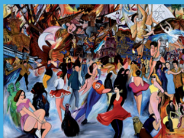
Jean-François de Bus, Baie des Anges, 116x81cm